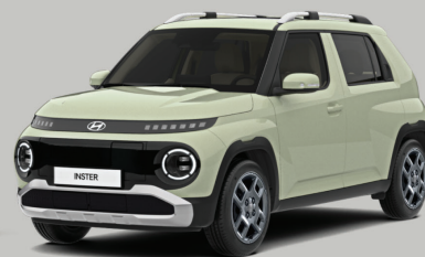
Fun 電小精靈 INSTER