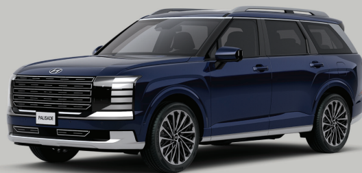
SUV 旗艦王者 The All-New PALISADE